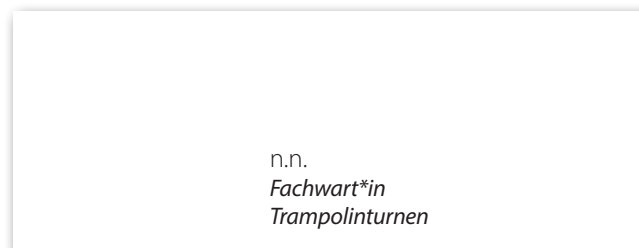
n.n. Fachwart*in Trampolinturnen